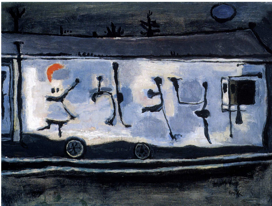
compositie met treintje (1952)