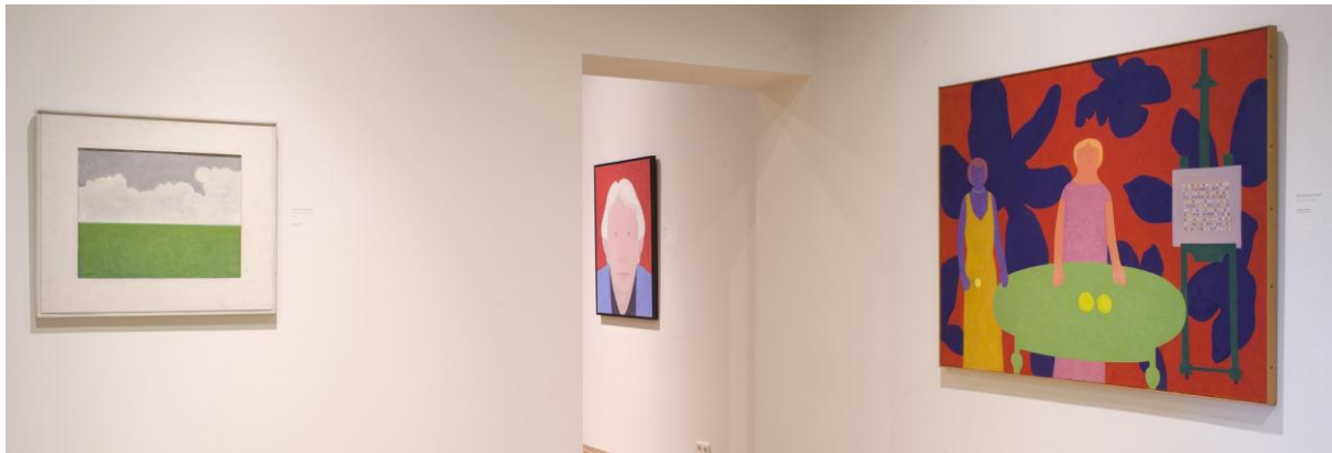
tentoonstelling in Drents Museum (19 januari t/m 19 juni 2016)